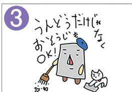
体を動かすことでもOKです