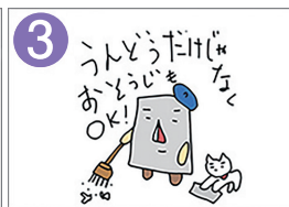
3 ほんどうだけじゃなくて 体動かすことでもOKです