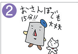
15分間運動を続けます