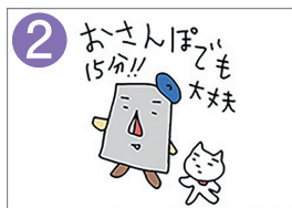
2 おさんぽでも大丈夫 15分間運動を続けます