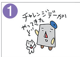
1 チャレンジデーがいよいよ来た チャレンジデー当日の0時～21時に