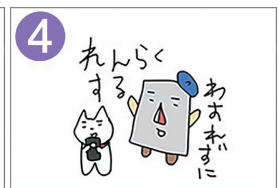
4 んんく あすおに 下記の連絡先に報告します