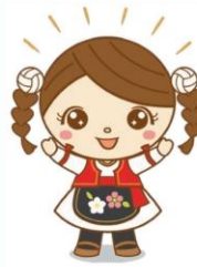
セルビー セルビアホストタウン推進事業 マスコットキャラクター